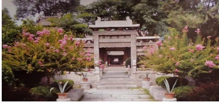
Pekin Büyük Camii'nin bahçesinden bir fotoğraf

Çin'de Müslüman nüfusu 30 milyon olarak ifade edilse de İhsan Hoca'nın tahminlerine göre daha fazladır. Çin'in çeşitli yerlerinde çok sayıda cami vardır. Bunlardan en eskisinin Tsing-Kiao-Sze veya Ten-Çen-Zı olduğu tahmin edilmektedir. Sadece Pekin'de 100'ün üzerinde cami bulunmaktadır. Sosyalist bir hükümet olmasına rağmen Çin hükümeti Müslümanların dini yaşamına engel olmamaktadır. Nitekim hâlâ medreselerde dini eğitim verilmekte olup buralarda binlerce hoca yetişmektedir. Müslümanlar için paralarının üzerinde Arapça harfler bile bulunmaktadır.